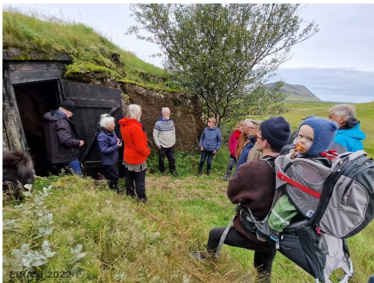
Í Hólsbraut, við einn af hellunum út frá Gamla-Felli, sem voru nýttir fyrr á öldum.