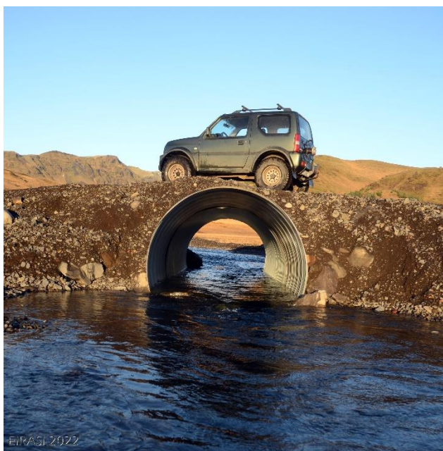
Ræsið við Keldudalsá eftir að ræsið var endurnýjað með einu stóru röri.

Almennt voru vegamál á Fellsmörk nokkuð hefðbundin á þessu ári eða jafnvel með betra móti. Helstu vandamál hafa verið tengd ræsinu á Keldudalsá en eftir síendurtekin vandamál var ræsið endurnýjað með einu stóru röri í stað tveggja minni. Eftir þær umbætur hefur það að mestu verið til friðs þó aðeins hafi runnið úr því.