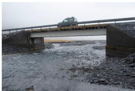
Brúin á Holtsá í febrúar 2023, efni grafið frá endum brúarinnar.