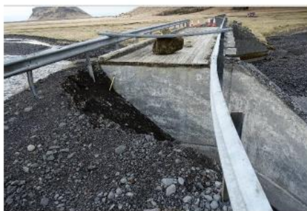
Skemmdir á brúnni á Holtsá í nóvember 2018.

Sama á við um efnisnámu E5 sem er fyrir neðan brú á Klífanda. Þar hefur efnistaka ekki verið undanfarin ár en með því að setja efnisnámu þar, má gera ráð fyrir að sú brú geti einnig verið í hættu.